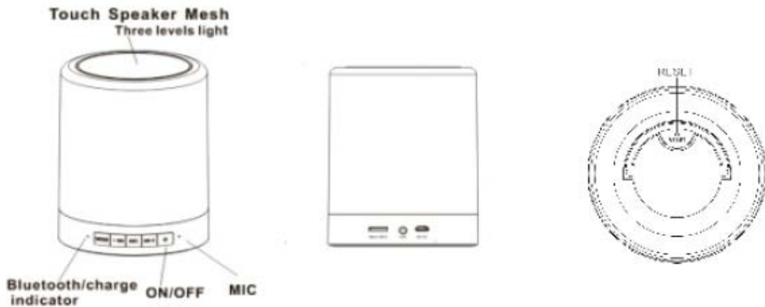
Imagem do funcionamento: